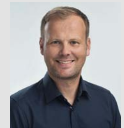
André Kranzusch Orthodontic Software Consulting

FORTBILDUNGSPUNKTE: Es werden 16 Fortbildungspunkte gemäß den Richtlinien der BZÄK / DGZMK vergeben.